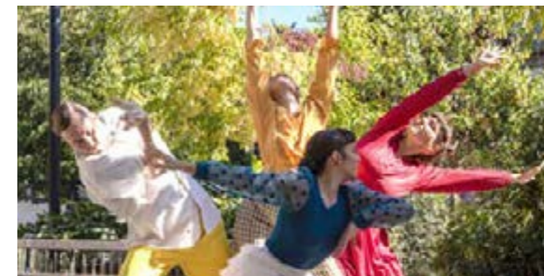
↑ LES SCHINI'S

Une invitation à un voyage onirique reliant la culture ibéro-latine à celle d'Afrique de l'Ouest.