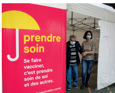
▲ Centre de vaccination à Marcheprime

Aussi, parce que les conditions d'épanouissement de tous les jeunes ont des conséquences sur leur avenir, la collectivité poursuivra de nombreux projets améliorant le bien-être des collégiennes et des collégiens.