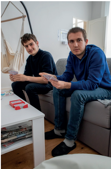
▲ Habitat inclusif, pour ces jeunes hommes autistes