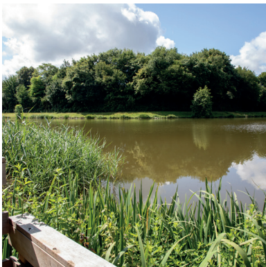
▲ Base départementale de Blasimon

Au-delà de ses missions de prendre soin, le Département agit dans de nombreux domaines, dans le cadre de ses compétences, pour prévenir les risques et limiter l'impact de l'activité humaine sur la santé des Girondines et des Girondins. A travers sa stratégie de résilience territoriale ; d'anticipation des risques et d'adaptation urgente face aux changements sociétaux et environnementaux, la collectivité vise ainsi à multiplier les solutions, au côté des territoires et des citoyens pour améliorer les conditions de vie et la santé des générations présentes et futures. Dans les prochaines années, le Département renforcera la prise en considération des enjeux de santé dans l'ensemble des politiques menées afin de mieux prévenir les pathologies environnementales et d'atténuer les effets du changement climatique sur la santé et la mortalité. Parmi les priorités et actions engagées :