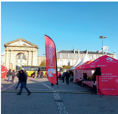
▲ Semaine du Sidaction, place de la Victoire à Bordeaux

L'accompagnement de la vie affective permet à la fois de prévenir les risques et de répondre à des situations d'urgence. En facilitant l'accès aux consultations individuelles et en déployant les actions collectives, le Département continuera de faciliter l'accès au conseil et au soin en permettant à chacune et chacun d'avoir le contrôle sur sa propre santé et en protégeant les plus fragiles.