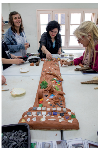
▲ Atelier mosaïques à Plassac

En 2019, le Docteur Piroška Östlin, directrice régionale de l'OMS pour l'Europe, a fait la déclaration suivante : « Introduire l'art dans la vie des gens par des activités telles que la danse, le chant, la visite de musées et la participation à des concerts permet d'apporter une nouvelle dimension à la façon dont nous pouvons améliorer la santé physique et mentale ». A travers son soutien à la vie culturelle et artistique, le Département continuera, en partenariat avec l'IDDAC, d'encourager les projets facilitant l'accès à la culture de toutes et tous avec une attention particulière en direction des personnes en situation de handicap, des personnes âgées, ainsi que des enfants protégés et des jeunes.