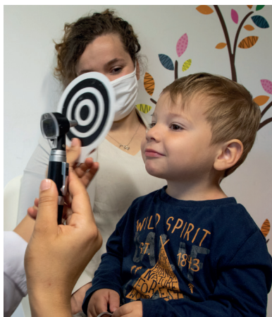
▲ Consultation PMI

À DOMICILE RÉALISÉES PAR LES SAGE-FEMMES DE PMI