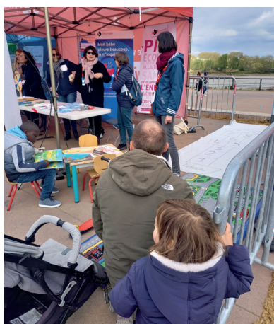
▲ Village de l'autisme sur les quais de Bordeaux

Aussi, parce que la perte d'autonomie, liée à l'âge ou au handicap, appelle souvent des réponses au sein d'établissements spécialisés, le Département continuera d'encourager la création de places nouvelles et restera attentif au parcours de soin des personnes dépendantes au sein des structures.