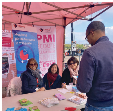
▲ Stand PMI au village de l'autisme, sur les quais de Bordeaux

Ces missions de santé publique d'accompagnement de la parentalité mais aussi de suivi des nourrissons, bébés et jeunes enfants, font du Département l'acteur de référence de la Stratégie des 1 000 premiers jours (2) .