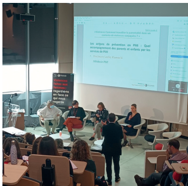
▲ Journée contre les violences faites aux femmes de novembre 2022