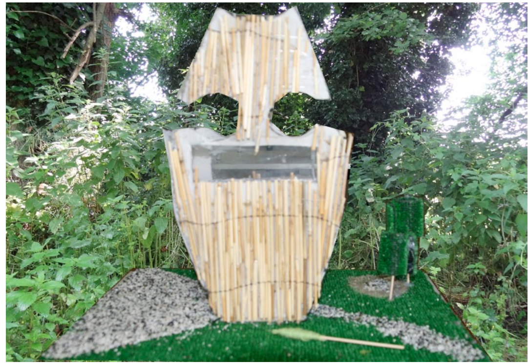
photomontages créés à partir des photos des maquettes des élèves et de celles prises lors de l'implantation ( voir page suivante )