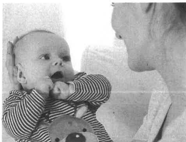
Faire connaissance avec les habitudes de chacun.

Pour préparer le moment de l'adaptation, les parents du bébé et l'assistante maternelle se sont entendus pour organiser l'accueil de l'enfant et ses modalités. C'est au cours de ces différentes rencontres que la durée de l'adaptation a été déterminée en fonction des besoins de l'enfant, de la famille et de l'expérience de la professionnelle. C'est cette dernière qui en estime la durée pour le confort de tous. C'est aussi par l'adaptation que le contrat démarre. Il est donc essentiel que l'organisation de l'accueil ait été pensée. L'adaptation a pour objectif de « peaufiner » les détails et de faire connaissance avec les habitudes de chacun (enfant, parents, assistante maternelle). La réussite de l'intégration s'appuie sur une séparation progressive et une connaissance mutuelle afin que l'enfant construise la séparation d'avec les parents et vive pleinement l'insertion chez son assistante maternelle.