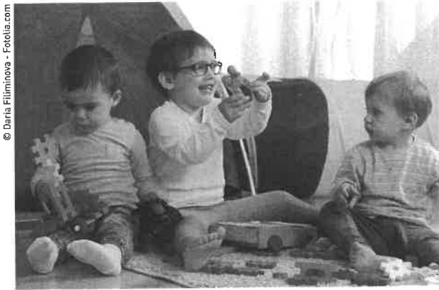
L'enfant accueilli doit se faire une place.

risson renseigne l'assistante maternelle sur ses besoins pour réajuster ses habitudes et s'adapter à lui. Un bébé est exigeant et ses demandes immédiates requièrent une grande disponibilité pour la professionnelle. Il semble avoir beaucoup plus de facilités à accepter son changement de lieu de vie, mais en apparence seulement, car le petit a des aptitudes toutes nouvelles qui doivent se renforcer pour entraîner sa sécurité affective et sociale. Une adaptation de deux semaines au minimum est souvent utile.