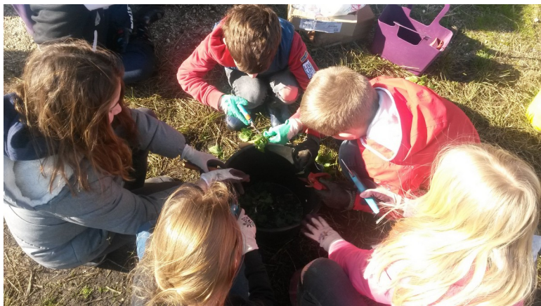
Club nature avec la CDC de Montesquieu