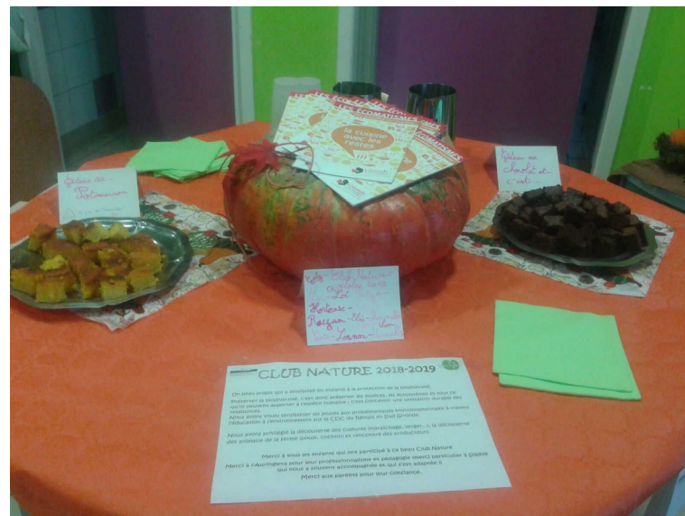
Club nature avec la CDC du Réolais en Sud Gironde