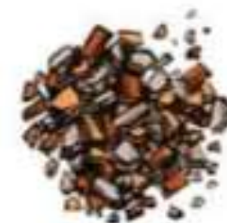
des graviers 2cm à 2mm