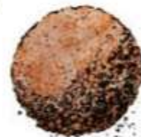
des sables 2mm à 60µm