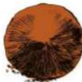
des silts 60µm à 2mm