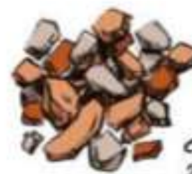
des cailloux 20cm à 2cm