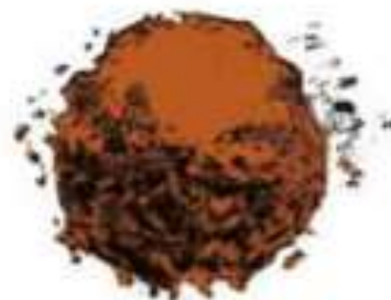
des argiles < 2µm