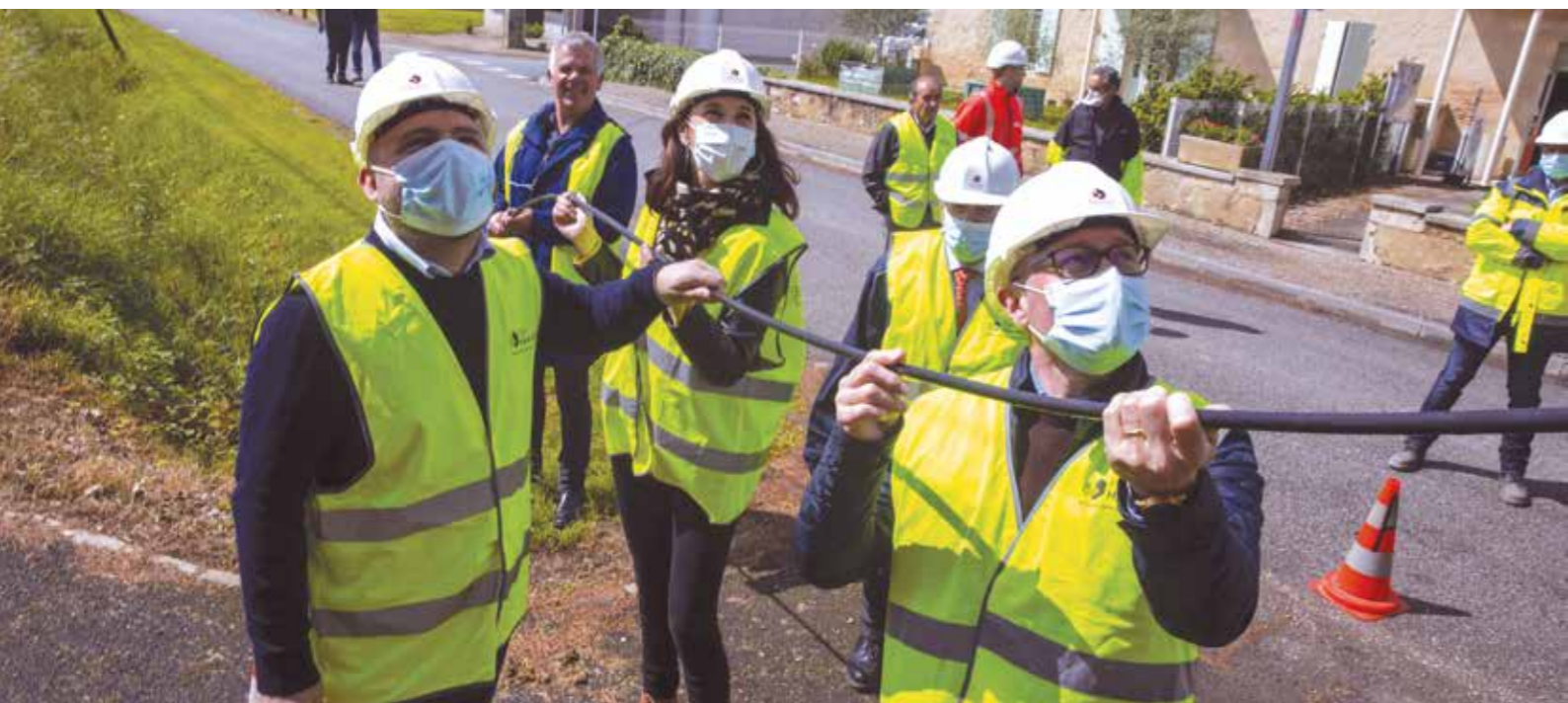
Chantier Gironde Haut Méga - Loupiac-de-La-Réole