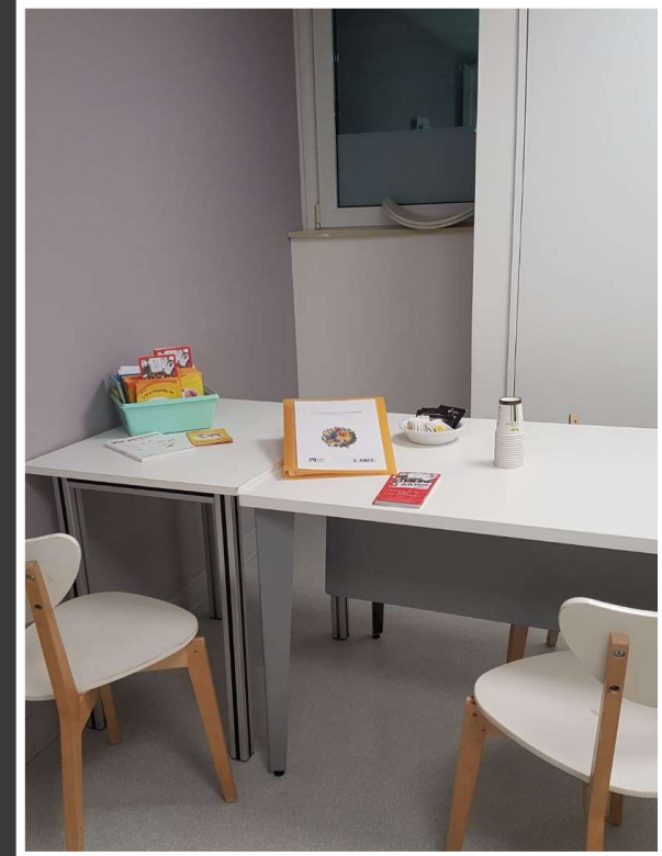
Présence de l'association AIDES