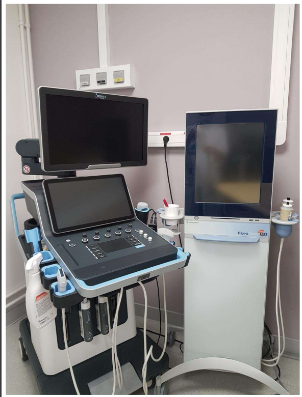
Evaluation de la fibrose