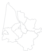
Les 9 territoires Solidarité (intégrant les ajustements de découpage effectifs au 1 er mars 2018)