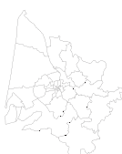
Les 33 cantons