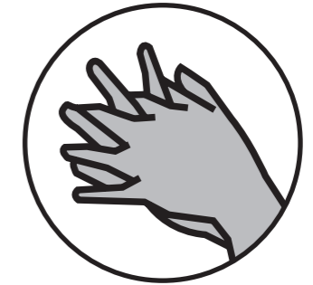
entre les doigts