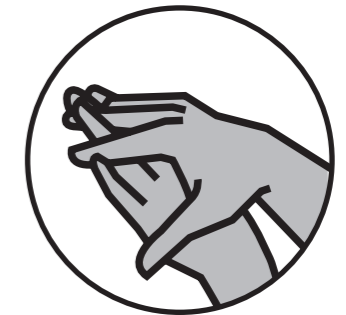
le dos des mains