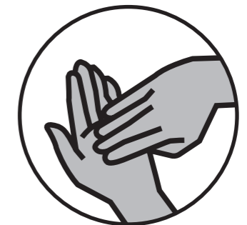
le bout des doigts