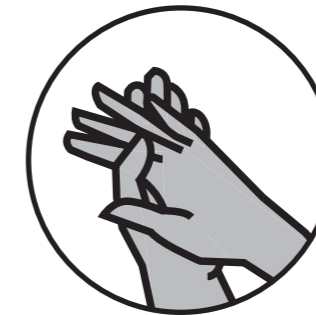
paume contre paume