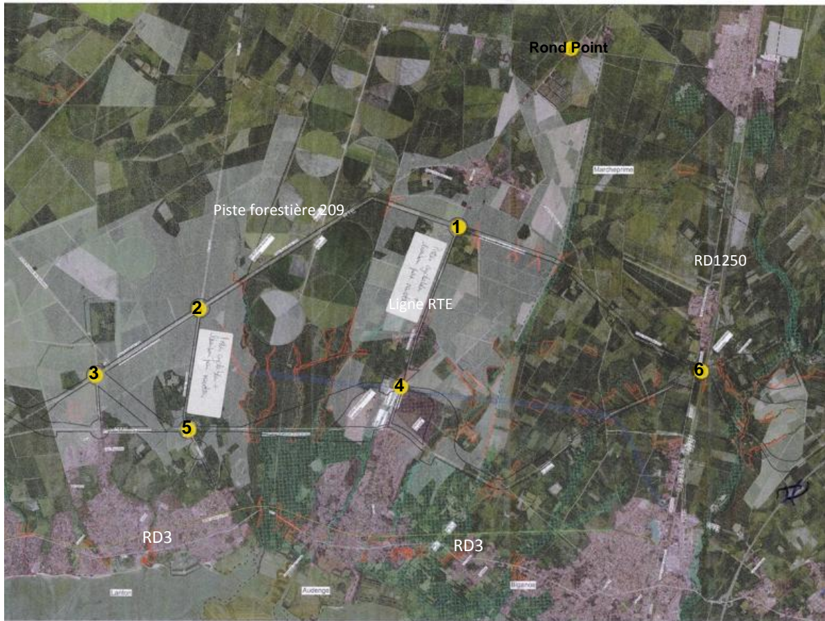
Support de travail mobilisé

Le groupe de travail rappelle qu'il sera important, pour les franchissements à réaliser, de permettre le passage de la faune mais aussi des piétons.