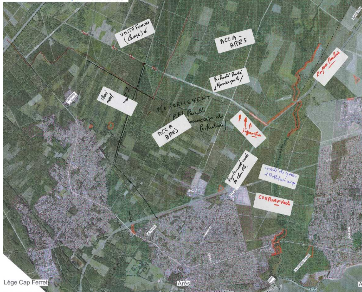
Support de travail mobilisé – Table n°1