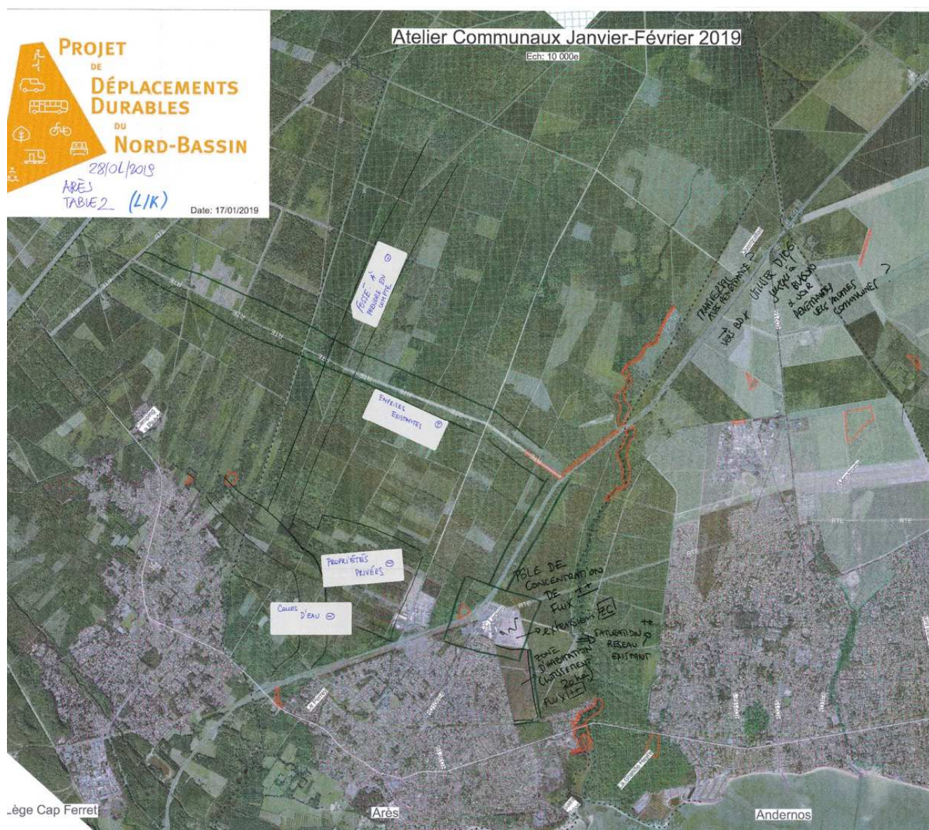
Support de travail mobilisé – Table n°2

Les participants soulignent la présence d'emprises existantes (lignes RTE 7 ) et précisent qu'il serait éventuellement souhaitable de les valoriser dans l'hypothèse d'un tracé.