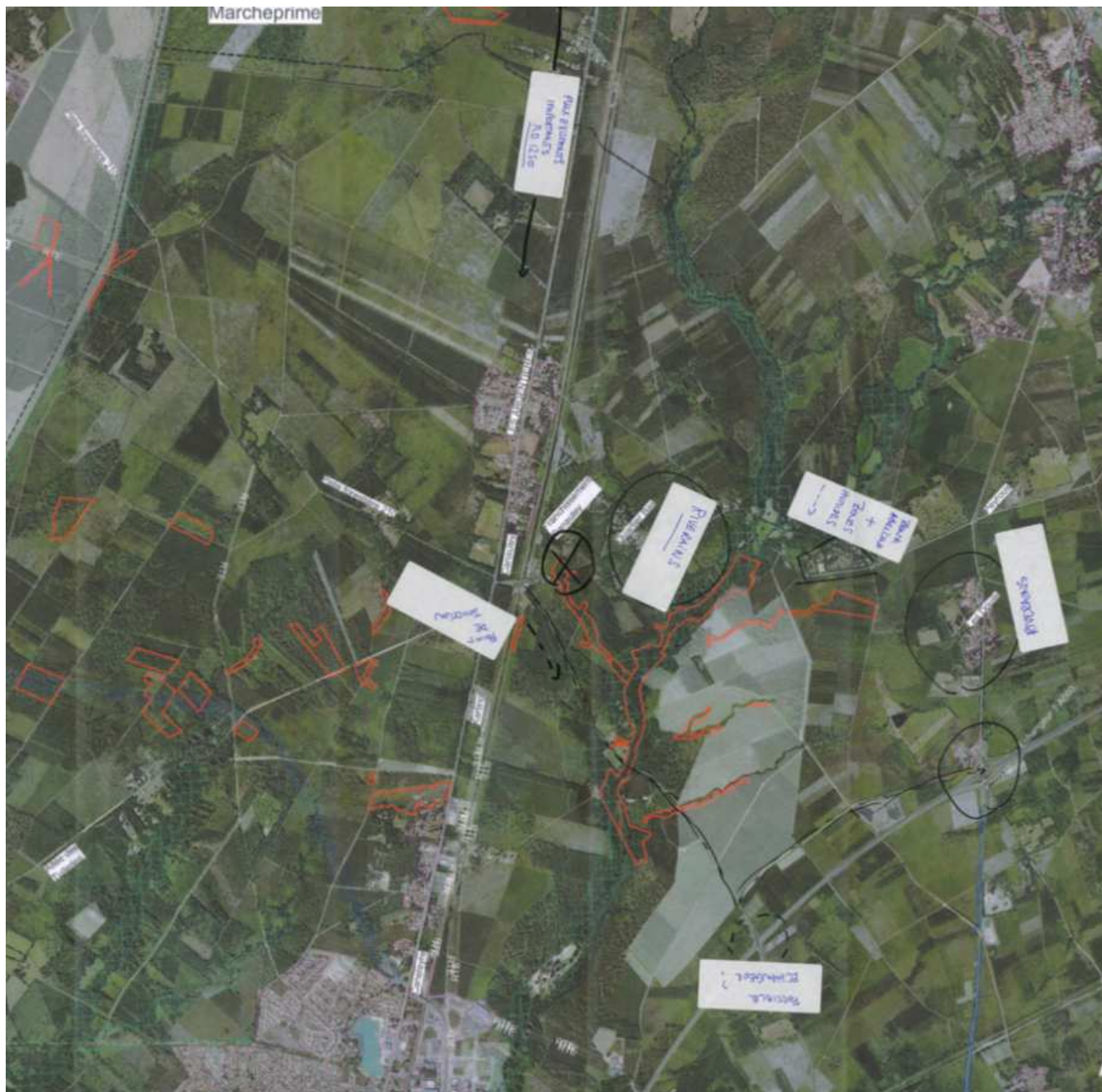
Support de travail mobilisé

La synthèse des enjeux identifiés par le groupe de travail communal est projetée sur le schéma ci-dessous :