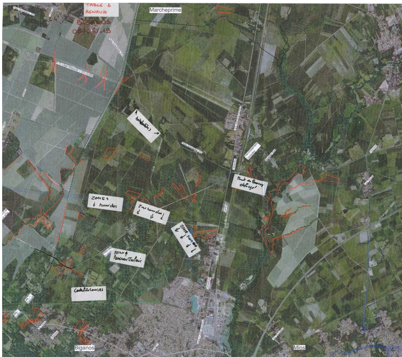
Support de travail mobilisé – Table n°2