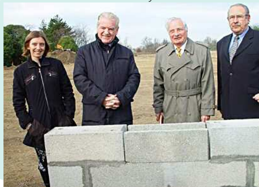
Pose de la première pierre du nouvel EHPAD d'Eysines «Bois Gramond».

L'EHPAD Belle Croix sera achevé en 2010 ■